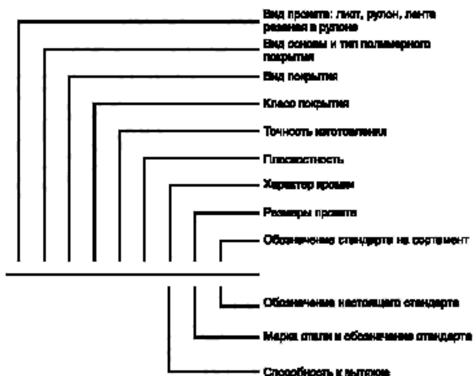
Схема условных обозначений проката с полимерным покрытием

Примечание — При отсутствии какого-либо из параметров его выбирает предприятие-изготовитель.